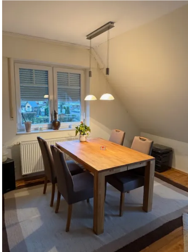
Blick auf Esszimmer