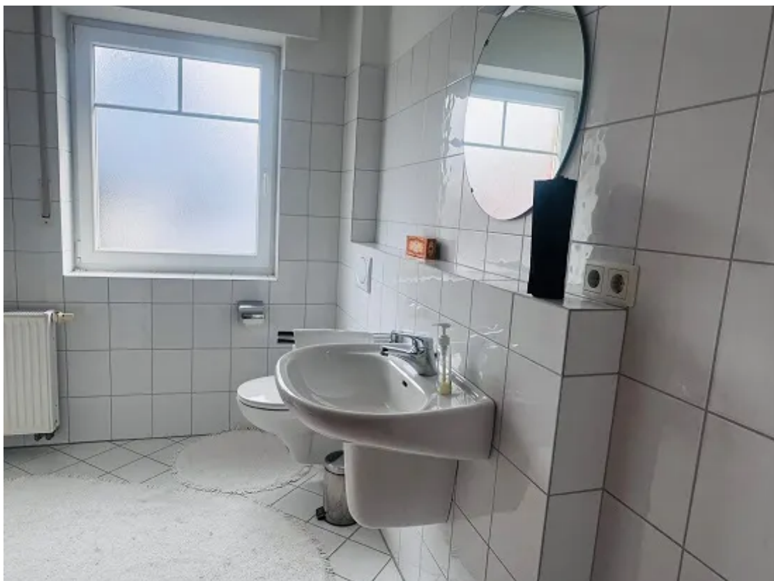
Badezimmer mit Fenster