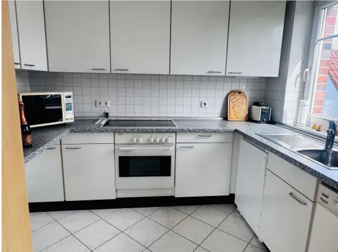
Gepflegte Küche mit Fenster