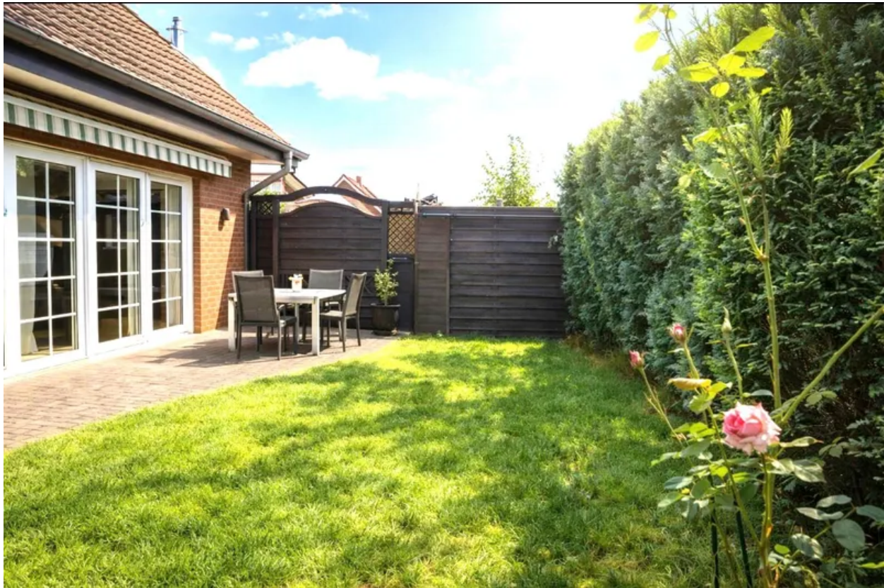
EG-Blick in den Garten