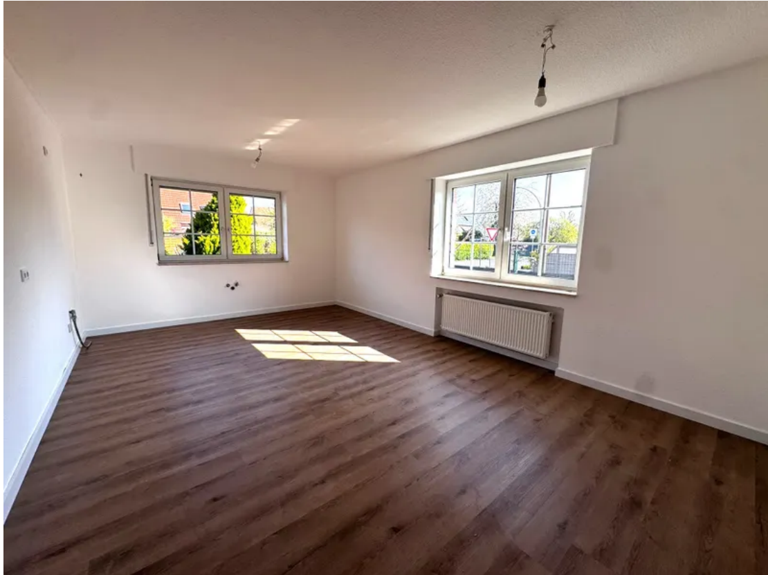
EG-Blick in die Küche