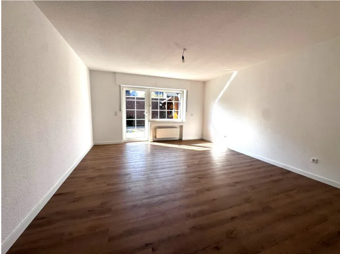
EG-Blick ins Schlafzimmer