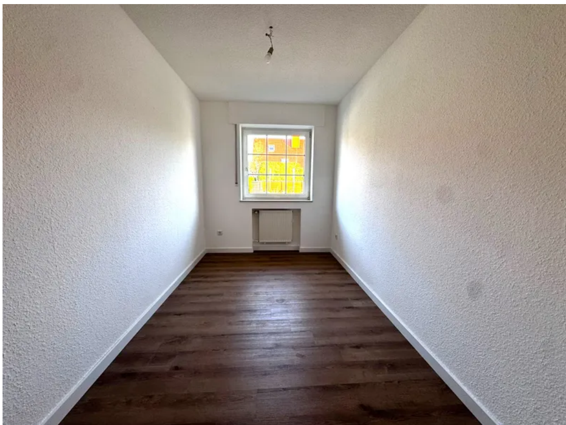
EG-Blick ins Kinderzimmer