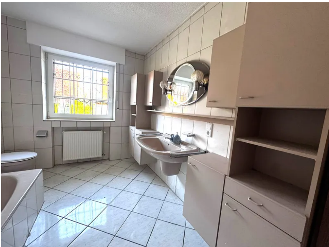
EG-Blick ins Bad