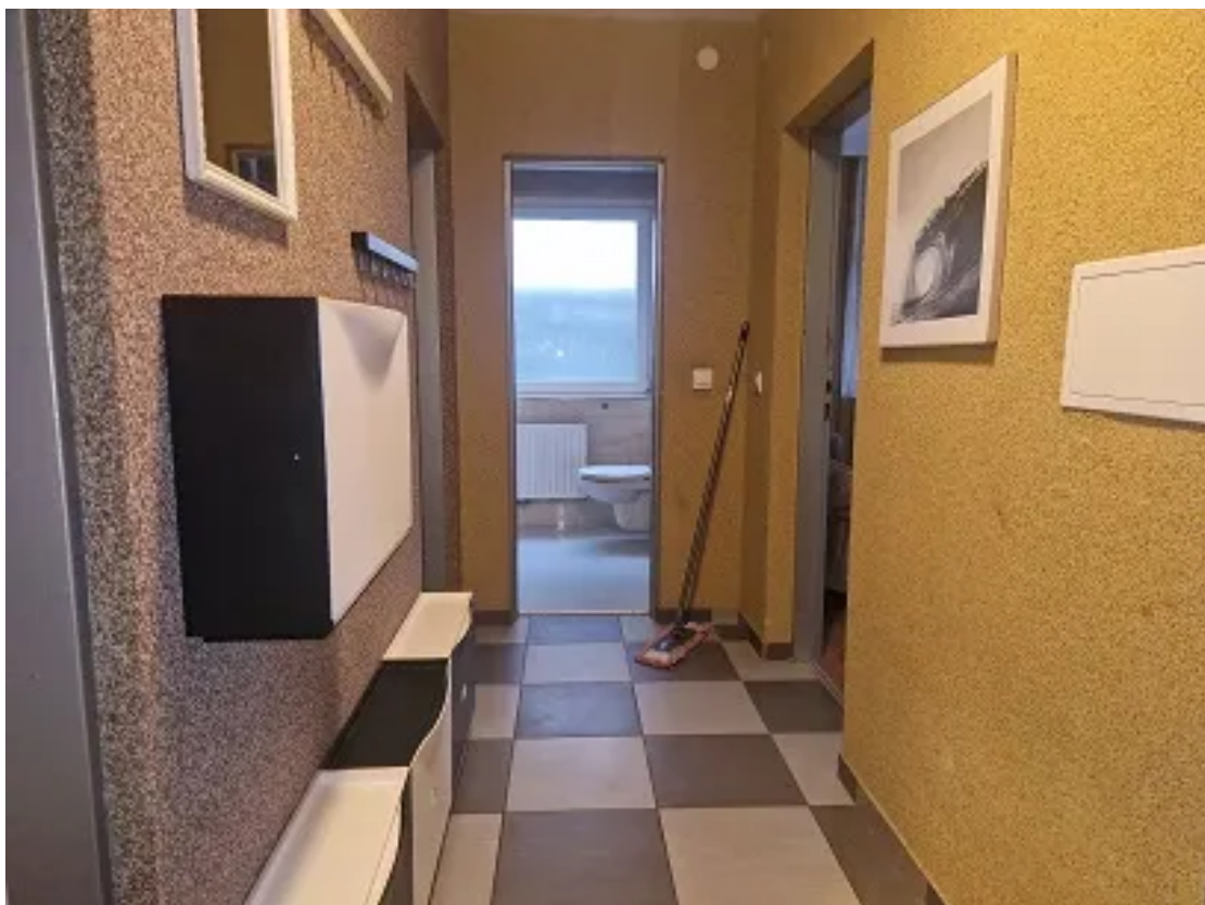
Blick in die Diele