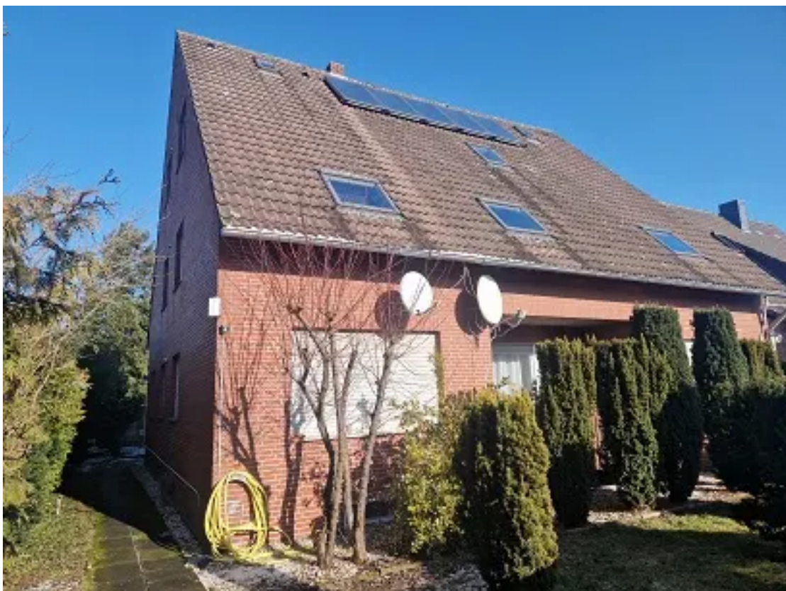
Ansicht der linken Giebelseite