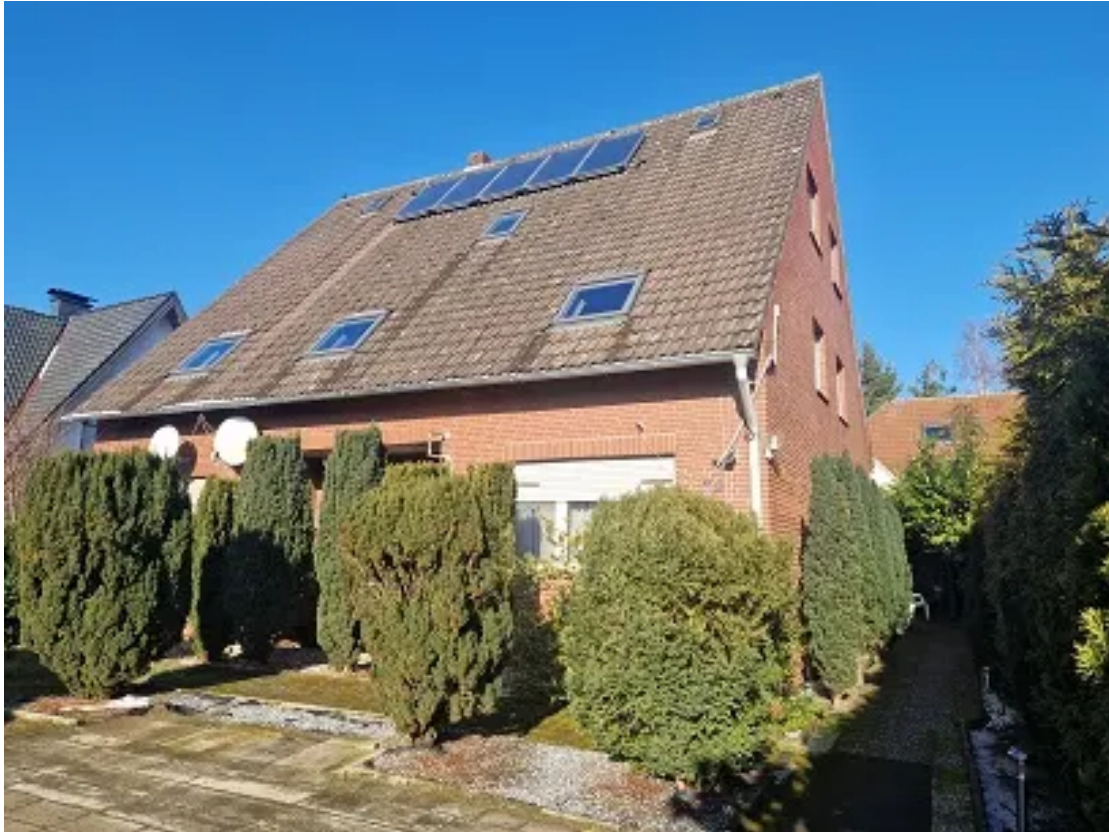
Ansicht der Giebelseite