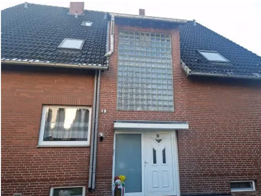
Ansicht der Frontseite