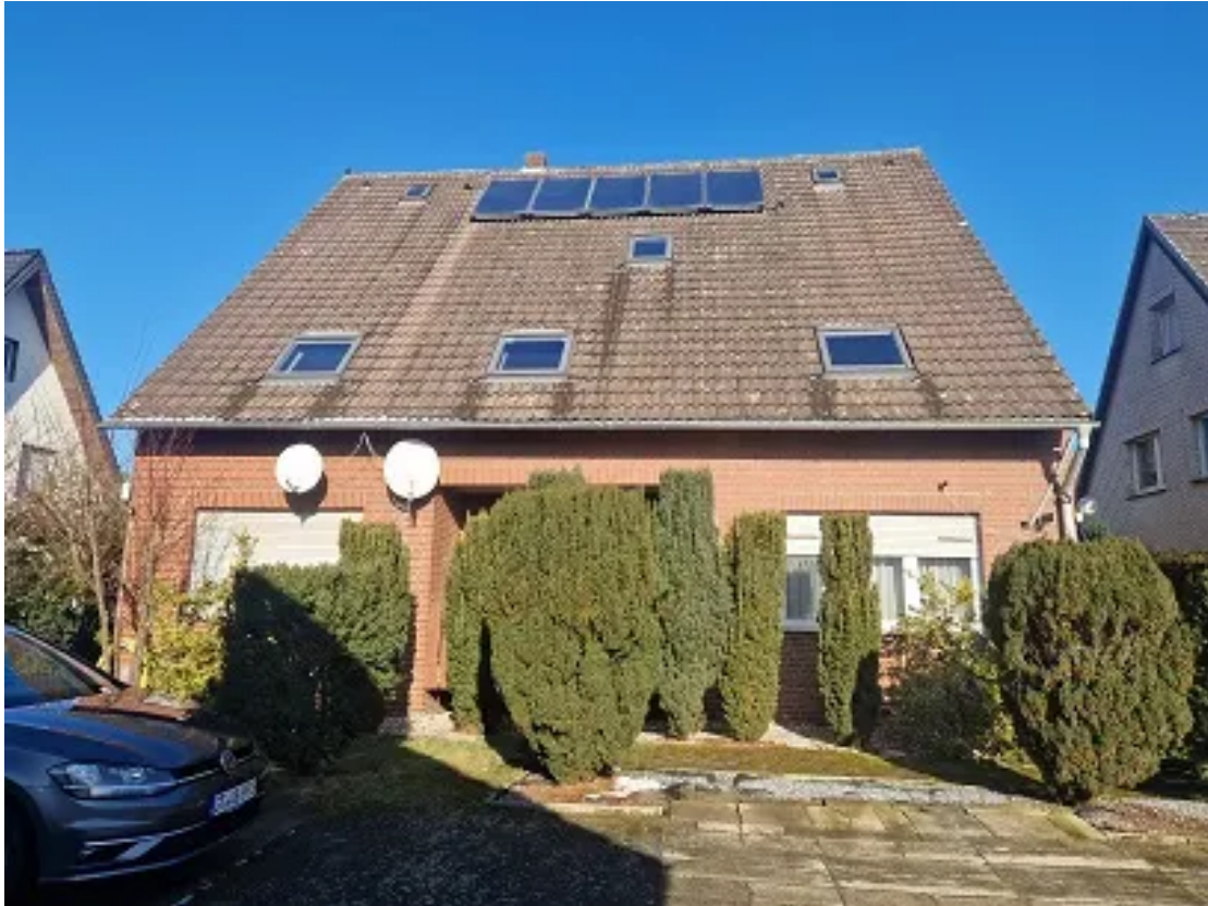
Ansicht der Gebäuderückseite