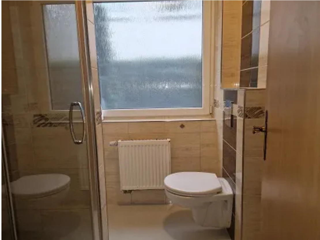
Blick ins Bad