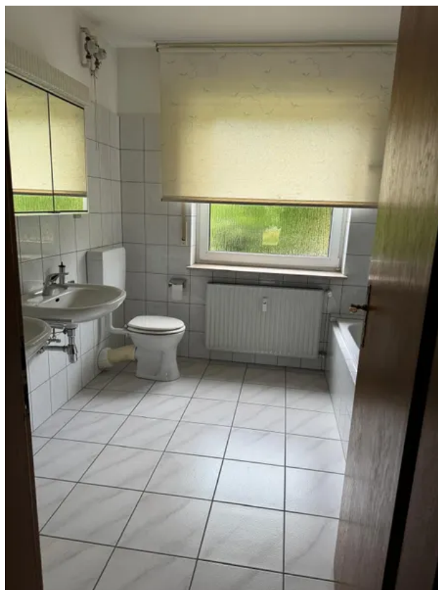
Blick ins Bad