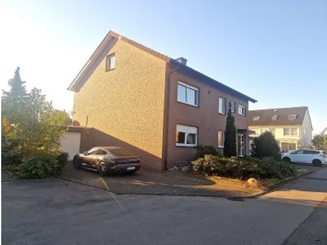
Blick auf Frontseite