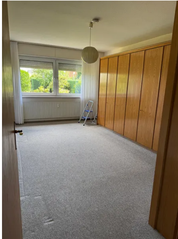
Blick ins Elternschlafzimmer