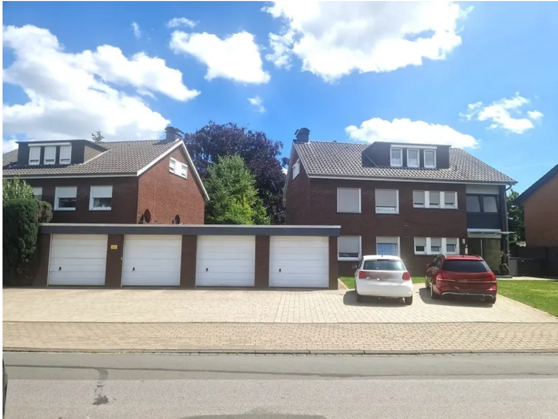
Frontansicht mit 4 Garagen